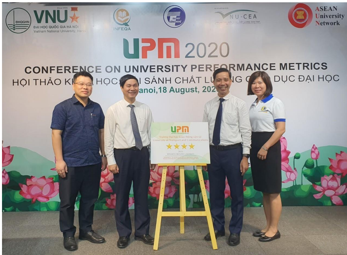
Đoàn cán bộ nhà trường tham dự Hội thảo và Lễ công bố kết quả xếp hạng UPM.