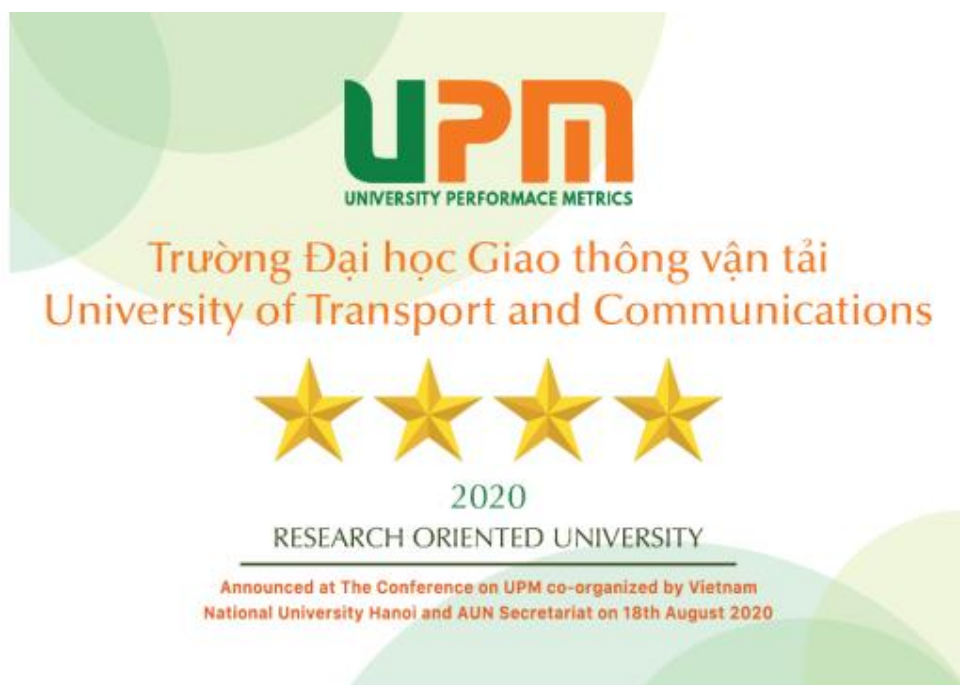
Kết quả gắn sao UPM năm 2020 của trường ĐHGTVT.